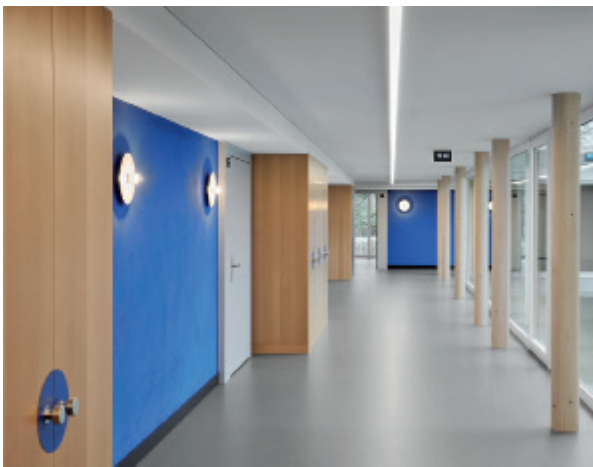
Helle Farbtöne kombiniert mit kräftigem Blau zeichnen die Innenräume des Alters- und Pflegeheims Bachwiesen in Ramsen aus.